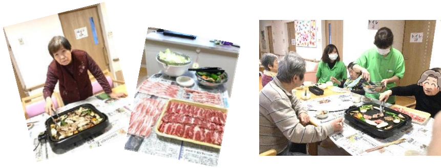
11月、下丁で行われた焼肉パーティーの様子です。ジュージューと音を立て、目の前で焼きあがるお肉の香り。皆さん箸が止まりません。