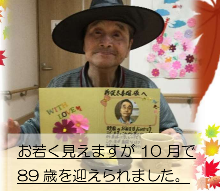
お若く見えますが 10月で 89歳を迎えられました。