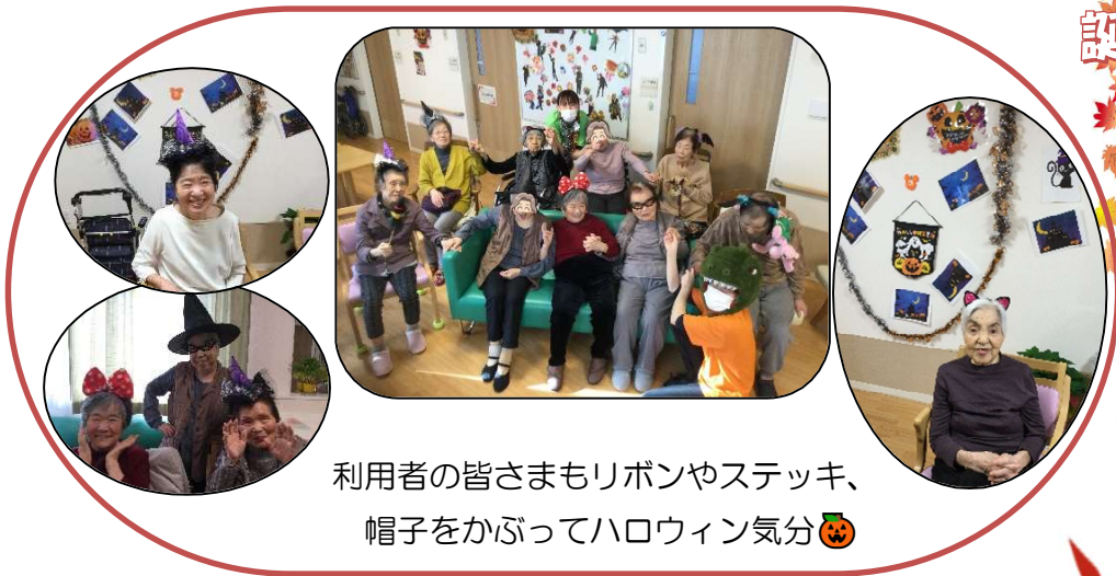
利用者の皆さまもリボンやステッキ、帽子をかぶってハロウィン気分🎃