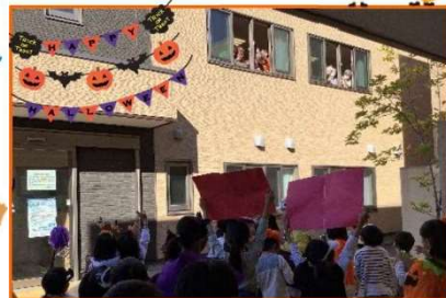
2Fの窓からもご挨拶