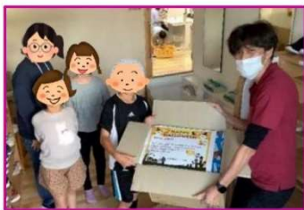
児童クラブへお菓子の寄付へ 理事長

毎年地域支援活動の一つとして、諸江地区児童クラブ主催の“ハロウィン行事”に子供たちへのお菓子プレゼントの寄付をしております。10月19日には施設に仮装した元気いっぱいの子供たちが会いに来てくれました！入居者さまも子供たちに会えるのを毎年楽しみにしています。直接会うことはできませんが、今年も子供たちの笑顔にたくさん癒され元気をいただきました。