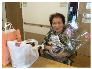
ご家族さまからの絵手紙や花束、お電話も皆さま大変喜ばれています。いつもありがとうございます。