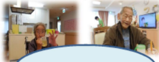
今年1番の良い笑顔