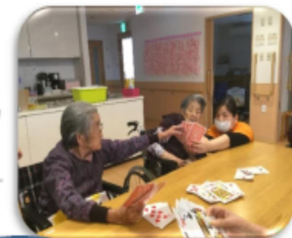
皆でババ抜き！ 真剣勝負！！