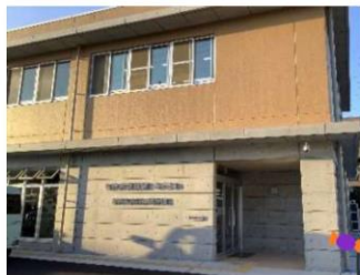
諸江地区 児童クラブみらい 出来たばかりでキレイでした！

10月19日には、施設に仮装した元気いっぱいの子供たちが会いに来てくれました！ご入居者様も子ども達に会えるのを、毎年楽しみにしています。窓越しではありますが、今年も子どもたちの笑顔にたくさん癒され、元気をいただきました。コロナ感染蔓延があり、“もろえみんなの食堂”の開催が見送りとなっており、地域の皆さまやご家族様との交流が限られていますが、色々なかたちで支援活動を続けてまいります。