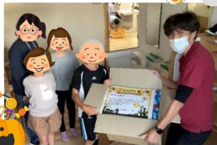
児童クラブへお菓子の寄付へ 理事長